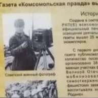
Советский военный фотограф

Памятный знак «Куйбышев — запасная столица. 75 лет Историческая справка Осень 1941 года для нашей страны стала временем тяжелых испытаний. Многие города оказались в оккупационной зоне. В этот период в Куйбышев перенесли штаб Верховного Главнокомандующего Красной Армией. В Куйбышев перенесли штаб Верховного Главнокомандующего Красной Армией. В Куйбышев перенесли штаб Верховного Главнокомандующего Красной Армией.