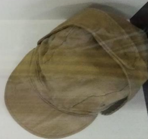
Кепка «Афганка» песочного цвета (Вещи времен войны в Афганистане, 1979-1989гг.,СССР)