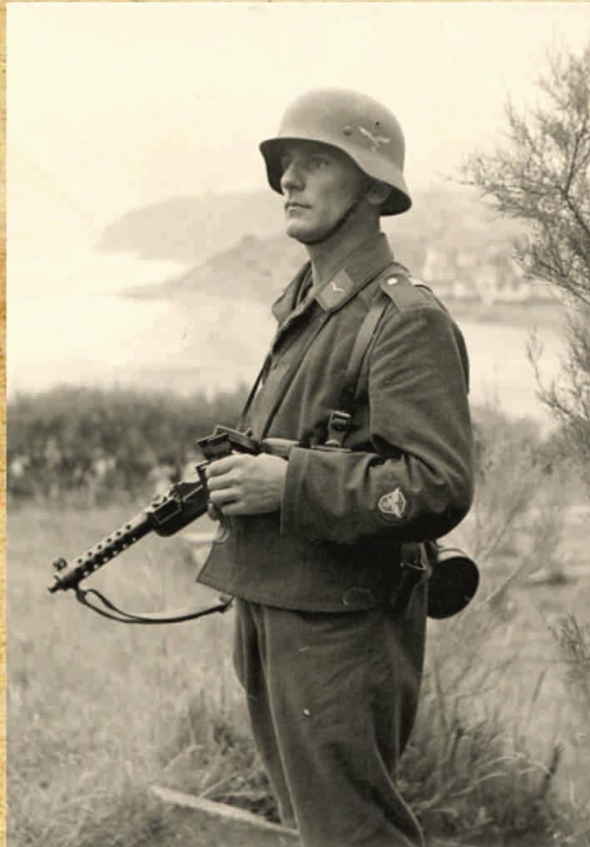
Немецкий солдат в каске м40

В 1942 году появилась новая модель шлема М42, в этой модели ухудшилось качество металла, из которого изготавливался шлем, он стал мягче.