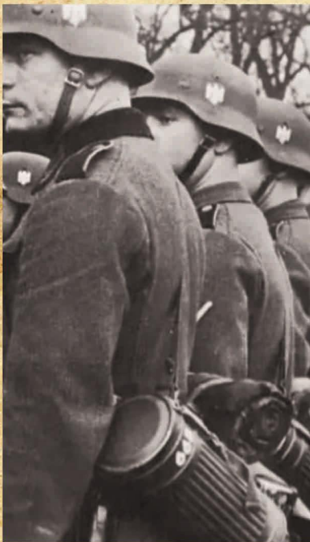
Немецкий солдат с емкостью для хранения противогаза

Газбаки были разработаны после печального опыта Первой мировой войны. Тем не менее, несмотря на все ужасы Второй мировой войны, до использования химического оружия страны (за исключением нескольких случаев) так и не дошли, а потому и противогазные сумки были по большей части бесполезны.