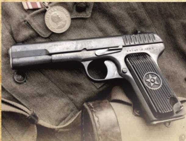
Пистолет «Тульский Токарев»

Пистолет ТТ был разработан для конкурса 1929 года на новый армейский пистолет, объявленного с целью замены револьвера «наган» и нескольких моделей револьверов и пистолетов иностранного производства, находившихся на вооружении Красной Армии к середине 1920-х годов. В качестве штатного патрона был принят немецкий патрон 7,63×25 мм Маузер.