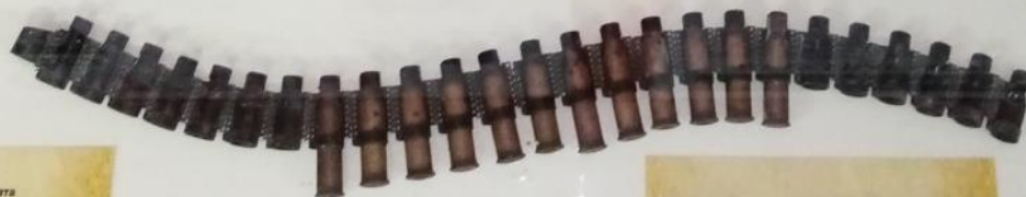
Пулеметная лента к пулемету Калашникова калибра 7.62