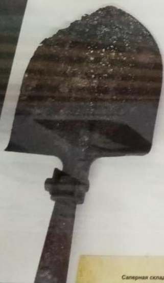
Саперная складная лопата

(Вещи времен войны в Афганистане, 1979-1989гг.,СССР)