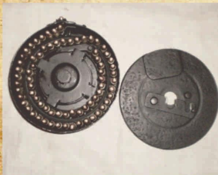
Магазин с патронами

Но пистолет-пулемет Шпитального требовал для своего изготовления еще больше времени, чем ППД – 25,3 часа. Шпагинский же пистолет-пулемет изготавливался за 5,6 часа. 21 декабря 1940 г. Комитет Обороны при СНК СССР принял постановление о принятии на вооружение Советской Армии пистолета-пулемета Шпагина. Ему было присвоено наименование «Пистолет-пулемет системы Шпагина образца 1941 года».