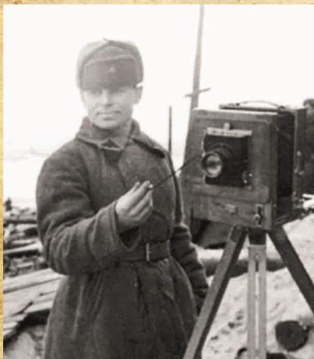
Советский военный фотограф

В 1945 году за заслуги в годы войны «Комсомольская правда» была награждена орденом Отечественной войны I-й степени. После войны газета создавала выездные редакции в разрушенном Сталинграде, на Днепрогэсе и других местах.