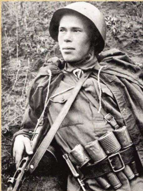
Разведчик с гранатами РГД 33