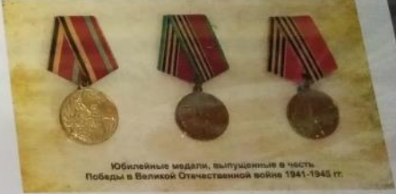
Юбилейные медали, выпущенные в честь Победы в Великой Отечественной войне 1941-1945 гг.