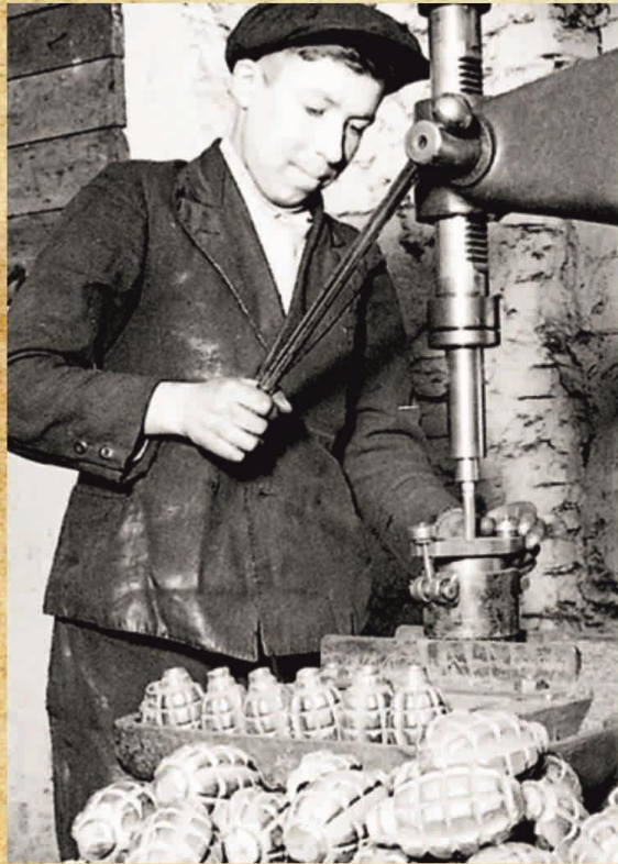
Рабочий фабрики изготавливает гранаты Ф1