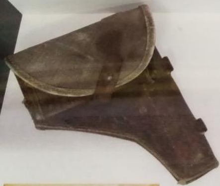
Кобура для пистолета «Тулский Токарев»(ТТ), «Наган» РККА. 1944г.