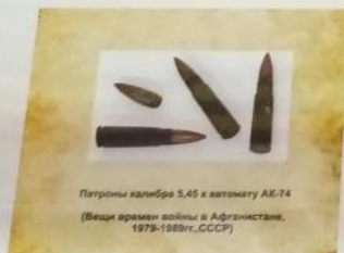
Патроны калибра 5,45 к автомату АК-74 (Вещи времен войны в Афганистане, 1979-1989гг.,СССР)