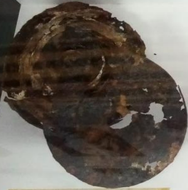
Дисковый магазин для ПШ 41 (листовет-пулемет Шлагина) РККА. 1941г.