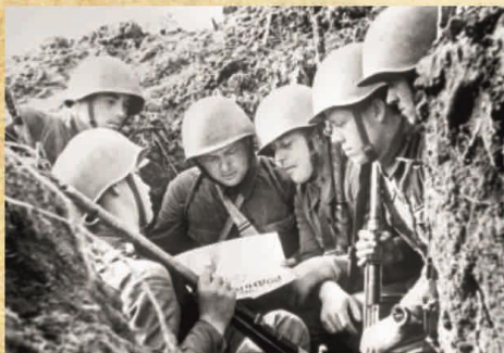
Солдаты читают газету