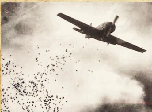
Немецкий самолет сбрасывает агитационные листовки

Основными целями немецкого пропагандистского воздействия на красноармейцев и командиров РККА, а также гражданское население в прифронтовой полосе являлось устрашение противника; усиление пораженческих настроений; создание позитивного представления о плене; подрыв авторитета государственного и военно-политического руководства СССР; побуждение к добровольной сдаче в плен и к дезертирству; подрыв авторитета командиров и начальников, неповиновение им; усиление недовольства гражданского населения положением в стране; побуждение населения к лояльному отношению к военнослужащим вермахта; усиление тревоги за судьбу родных.