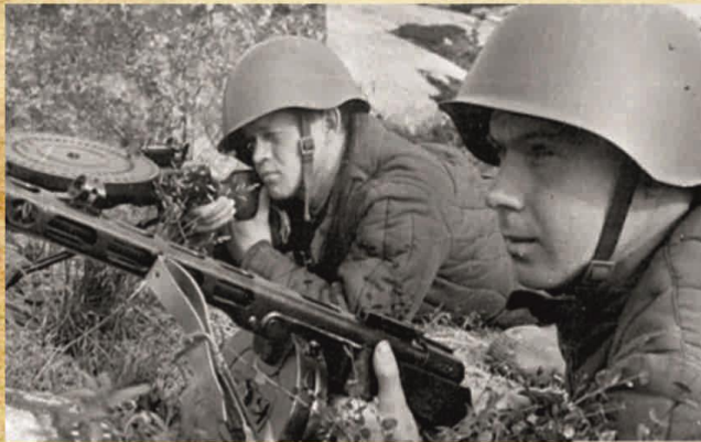
Солдаты красной армии в касках СШ 40

СШ-40 (Лысьвенская каска) — стальной шлем образца 1940 года, средство индивидуальной защиты военнослужащих, широко использовался в Вооружённых Силах СССР во время Великой Отечественной войны.