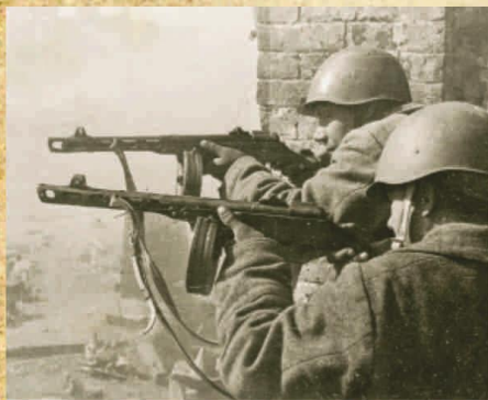
Солдаты РККА с ППШ