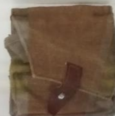
Гранатный подсумок на 2 гранаты Ф-1 (Вещи времен войны в Афганистане, 1979-1989гг.,СССР)