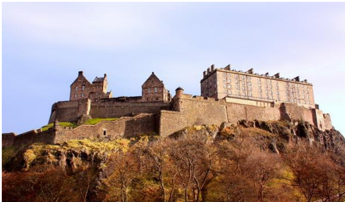
Знаменитый Эдинбургский замок возвышается на 133-метровой скале (остаток давно потухшего вулкана).

Впереди много всего интересного и необычного, мы постараемся побывать в каждом замке и познакомиться с его обитателями.