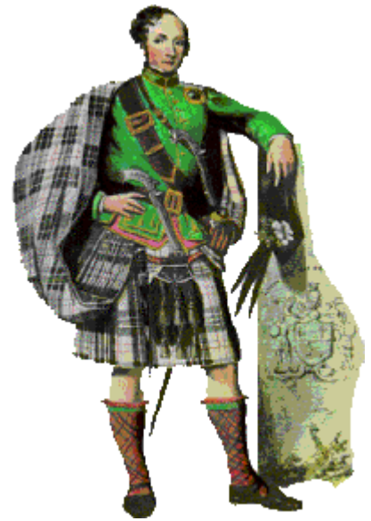
Рисунок тартана закреплён за тем или иным кланом или семейством, воинским подразделением или организацией

Килт — предмет мужской одежды , традиционная одежда горцев Шотландии .