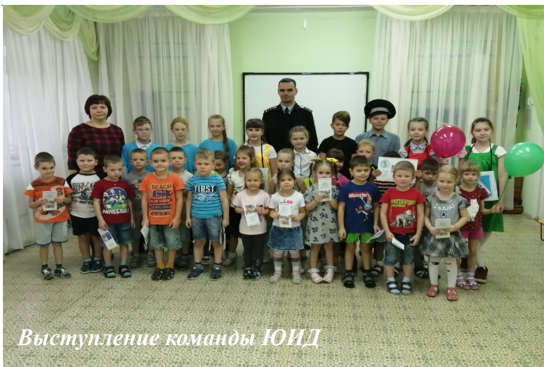
Выступление команды ЮИД