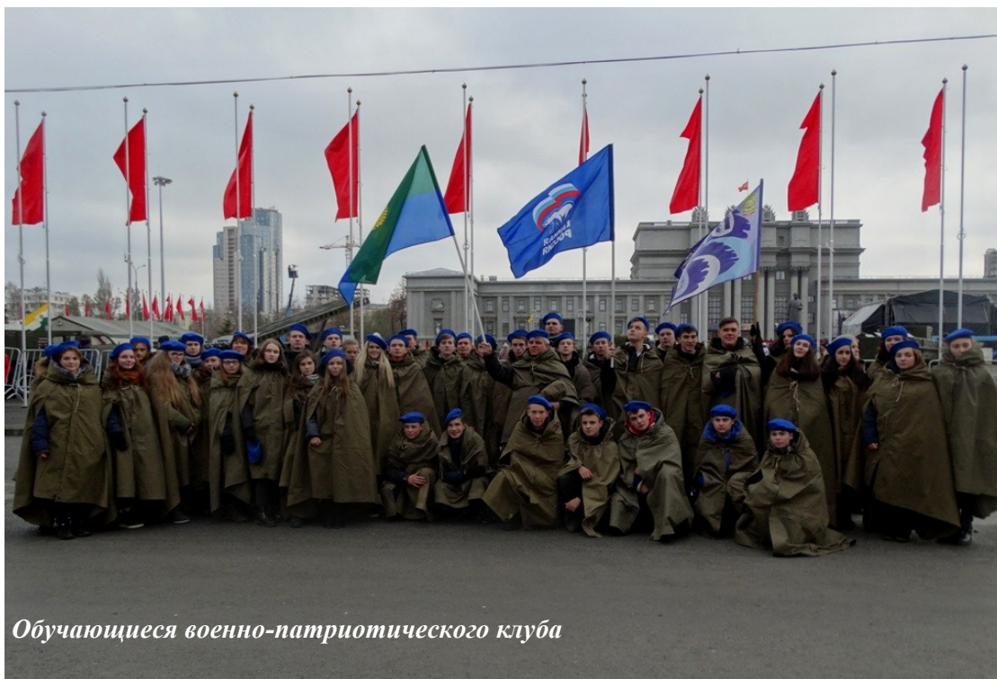
Обучающиеся военно-патриотического клуба