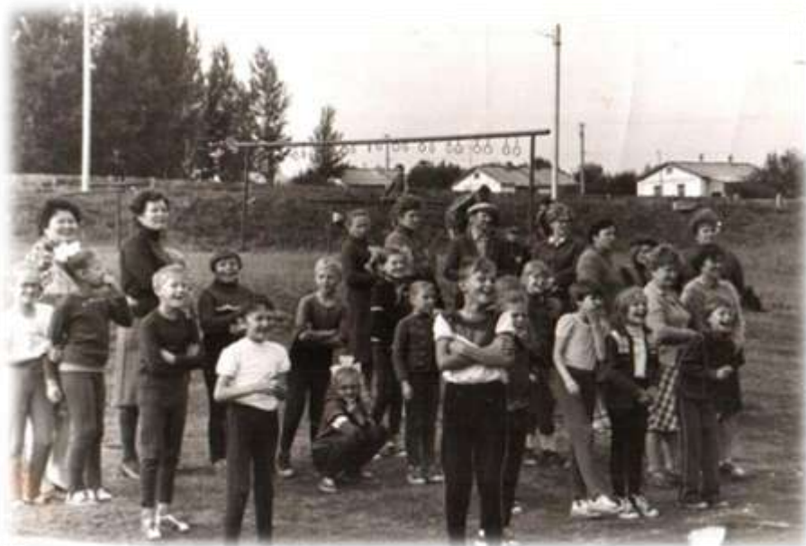
День бегуна 14 сентября 1986 г.